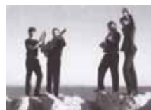
Sabor a Rumba