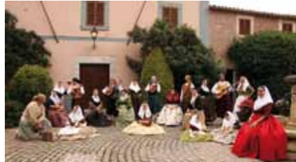
Aires Mallorquins de Palma