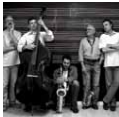
Miranda Jazz Quintet