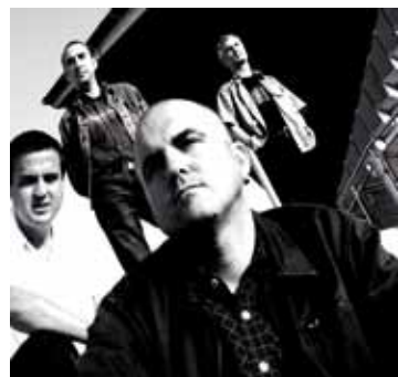
Gin Tonics Band

21.30 h Gin Tonics Band La Granja Dj Campos